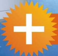
Elsotherm EWH 150 л