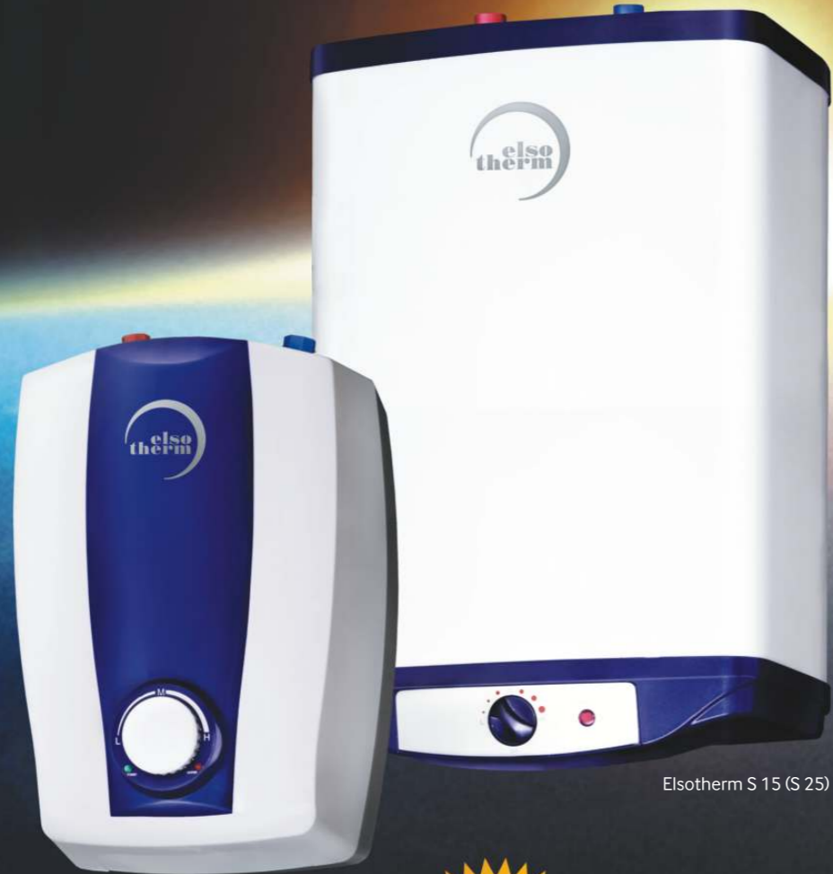
Elsotherm S 8