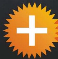
Elsotherm S 15 (S 25)