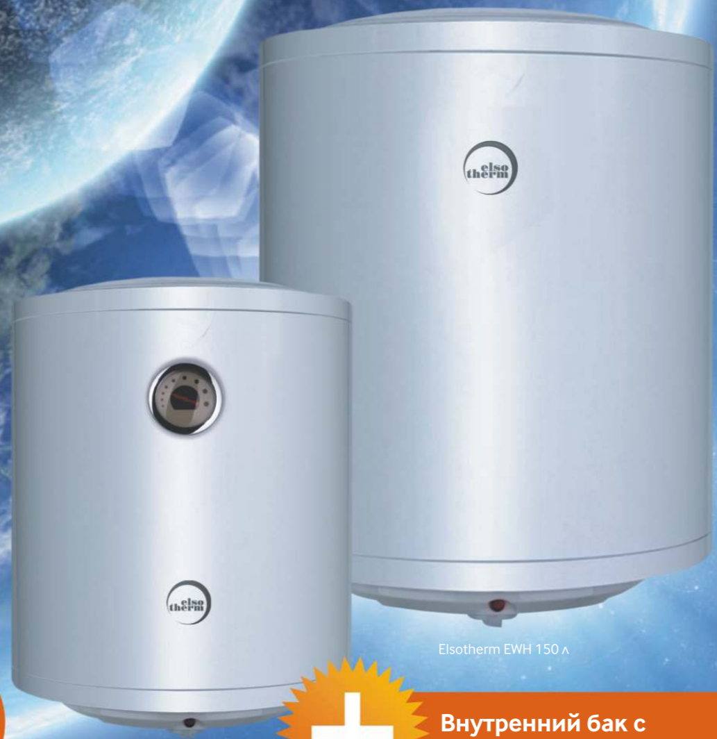
Elsotherm EWH 50 л

Эмалированный внутренний бак Круглый корпус