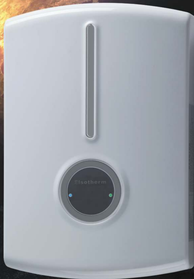
E Isotherm D