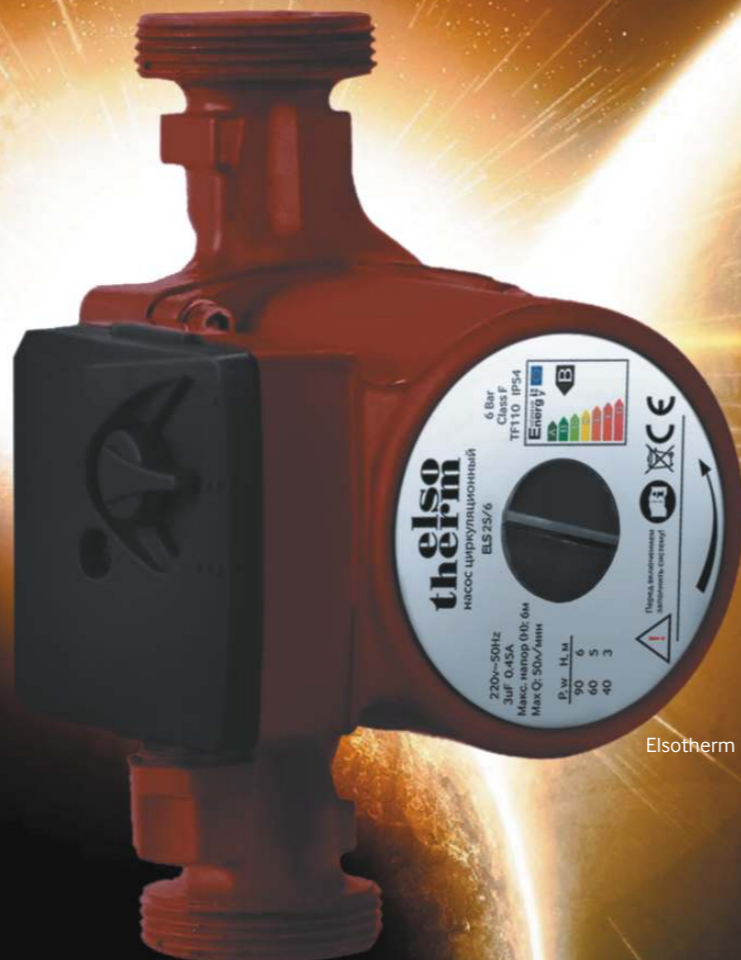
Elsotherm ELS 25/6